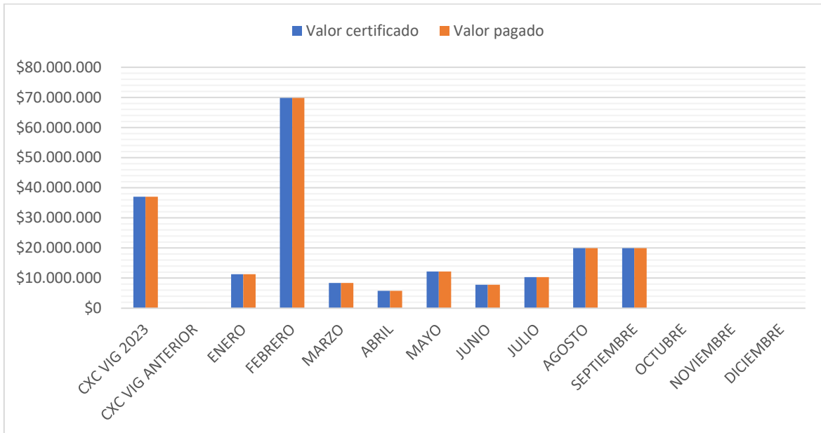
Ilustración 1 Comportamiento mensual recaudo Estampilla Pro-Usco Municipio de Garzón, 2024